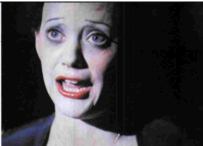
'La vida en rosa', sobre la cantante Edith Piaf, logró gran éxito de público y crítica.

Y, por fin, lo que parece la promesa más insólita: el biopic del poeta comunista salmantino Marcos Ana (Fernando Macarro Castillo, en realidad), que el director manchego Pedro Almodóvar dice que piensa hacer en fecha no muy lejana. Basada en el libro de memorias del escritor Decídme cómo es un árbol (Editorial Umbriel-Tabla Rasa) su historia parece haber conmovido al realizador que considera que "Marcos Ana ha sobrevivido con una limpieza apasionante al odio" y que "representa el mejor modelo de reconciliación".