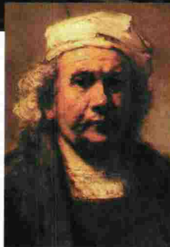
Peter Greenaway está trabajando en una cinta sobre Rembrandt y su famoso cuadro 'La ronda de noche'.

realizador, Olivier Dahan, que recibió un inesperado espaldarazo al abrir el Festival de Berlín del año 2007.